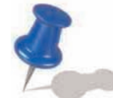
Table de concertation communautaire de Pointe-Saint-Charles